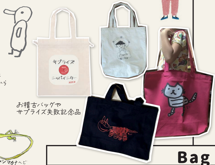
お稽古バッグや サプライズ失敗記念品